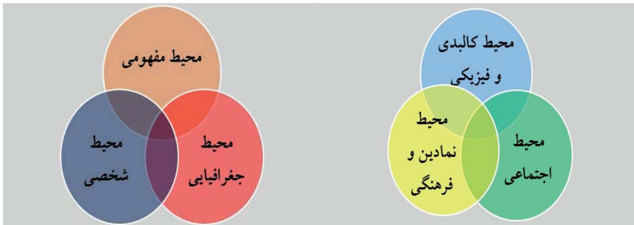
شکل شماره ۱- محیط از دیدگاه داگلاس پورتیوس. شکل شماره ۲- عناصر سازنده محیط شهری (منبع: غراب، ۱۳۸۰: ۸۸)